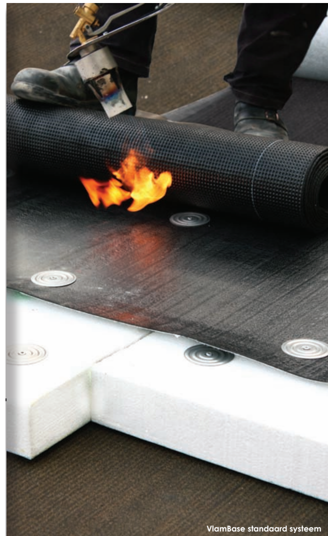
VlamBase standaard systeem

Beschermt naakte EPS duurzaam van begin tot eind