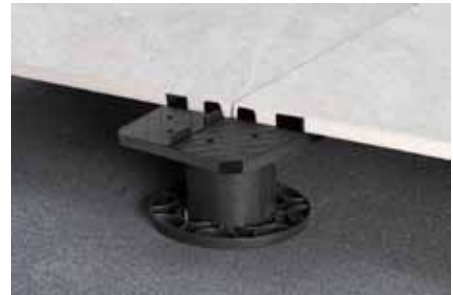
Ophogen met het DNS® systeem