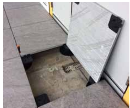
Na ontgrendeling is de ondergrond bereikbaar