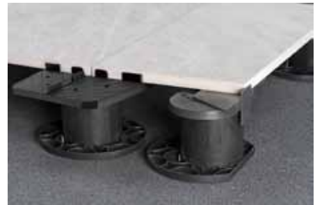
Ondersteuning en opsluiting met DNS® randzonesysteem