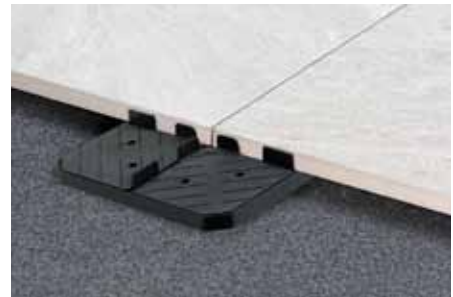
Tegels met fixplate lock op fixplate base