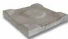
Dreentegel® 300 x 300 x 45 mm