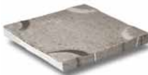
Dreentegel® 500 x 500 x 60 mm 600 x 600 x 60 mm