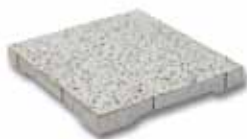
Dreentegel® 300 x 300 x 45 mm