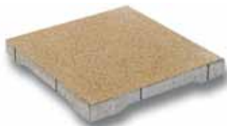
Dreentegel® 500 x 500 x 60 mm 600 x 600 x 60 mm